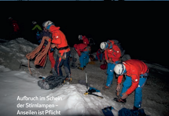
Aufbruch im Schein der Stirnlampen – Anseilen ist Pflicht für die bis zu 45 Grad steile Westflanke des Eigers.